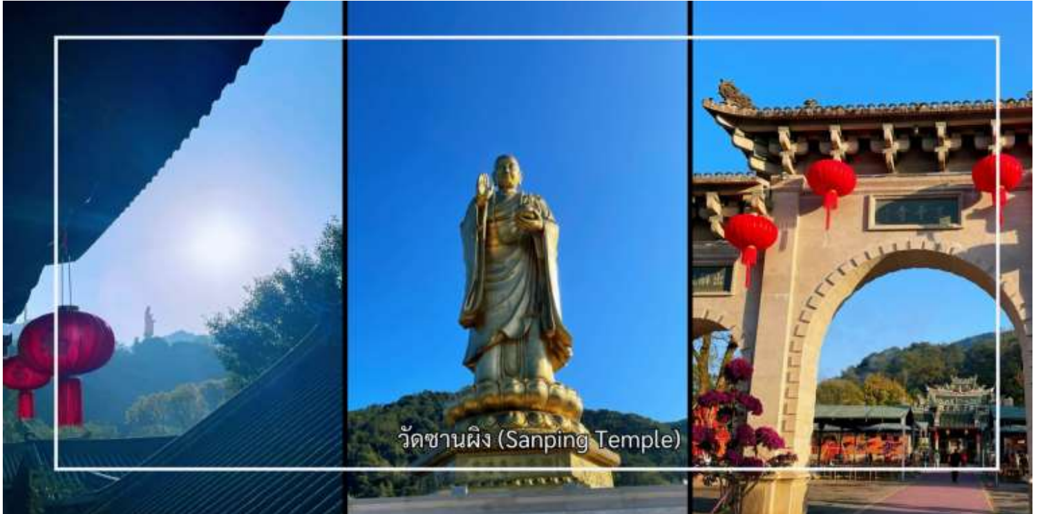
วัดซานผิง (Sanping Temple)

หลังอาหารเช้านำท่านเดินทางสู่ เมืองจิ้งโจว (Zhangzhou) เมืองสำคัญทางประวัติศาสตร์และวัฒนธรรม เมืองแห่งนี้มีประวัติความเป็นมายาวนาน และมีบทบาทสำคัญในฐานะศูนย์กลางการค้า การคมนาคม และการแลกเปลี่ยนวัฒนธรรม นำท่านสู่ วัดซานผิง (Sanping Temple) เมืองจิ้งโจว วัดพุทธที่มีความสำคัญทางประวัติศาสตร์และเป็นที่ยึดเหนี่ยวจิตใจอย่างสูงของพุทธศาสนิกชน วัดแห่งนี้มีชื่อเสียงในฐานะศูนย์รวมแห่งศรัทธาและเป็นสถานที่ปฏิบัติธรรมที่สืบทอดมาอย่างยาวนาน วัดซานผิงโดดเด่นด้วยบรรยากาศอันสงบ ร่มรื่น รายล้อมด้วยธรรมชาติและสถาปัตยกรรมจีนดั้งเดิมอันงดงามผู้มาเยือนสามารถสักการะสิ่งศักดิ์สิทธิ์ เรียนรู้ประวัติความเป็นมาของวัด และสัมผัสถึงความสงบทางจิตใจ