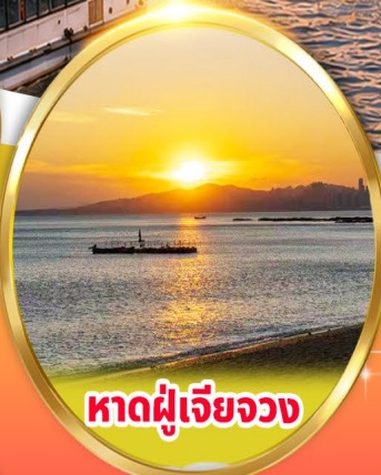
หาดผู้เจียวจง