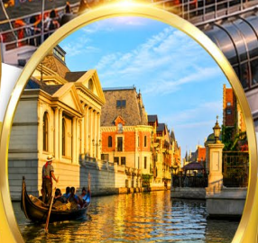
Venice Water City