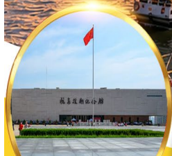
พิพิธภัณฑ์สงคราม เกาหลีตานตง

• ล่องเรือแม่น้ำยาลู่ เปิดมุมมองชายแดนจีน-เกาหลีเหนือ •